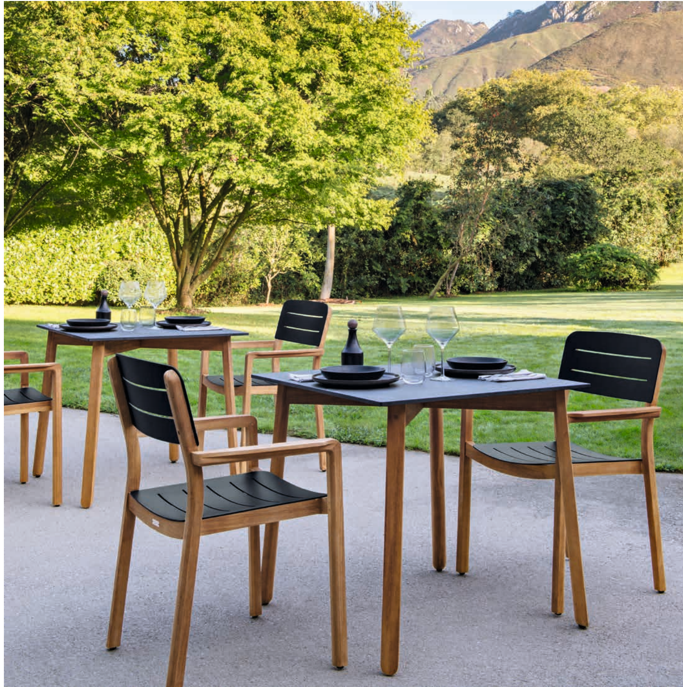
LODGE - Design Studio Vlaemynck