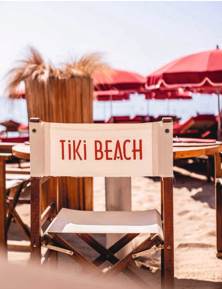
TIKI BEACH - RAMATUELLE - (France) | Collection DEAUVILLE

Au revoir « déjà-vu » Notre savoir-faire de confectionneur nous permet de vous proposer une personnalisation dans les moindres détails. Coordonnez vos coussins, toiles d'assises et parasols. Mieux, apposez-y votre logo ou un élément graphique qui marque votre empreinte. Notre mobilier se fond dans votre décor pour mieux le valoriser. Votre terrasse est à votre image, unique. Vous êtes partout Imprimer sur une toile (teint masse, Toile Technique d'Extérieur ou spéciale store), apposer un adhésif sur du verre ou sur un séparateur, broder sur les housses de coussins ou de matelas... Les solutions sont multiples et déclinables selon le matériau et l'espace à équiper (restaurant, bar, plage, lounge, piscine).