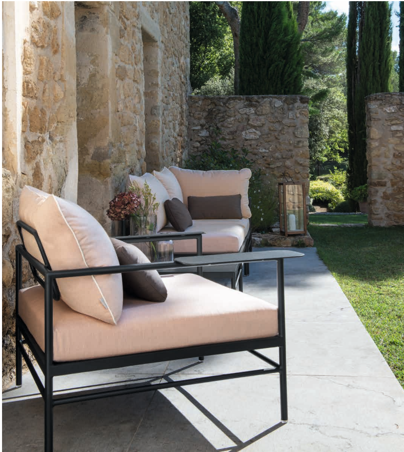
▲ RIVAGE - Ensemble lounge - Structure aluminium Basalte, coussins toile acrylique Quartz et coussins déco n° 88 toile acrylique Poivre brun