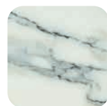
Effet marbre Marble effect Marmoroptik