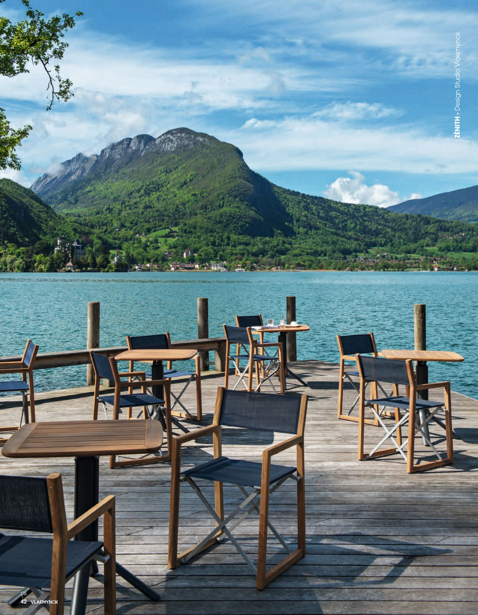
ZÉNITH - Design Studio Vlaemynck