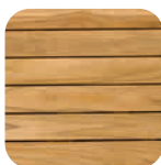
Teck naturel Natural teak Naturbelassenes Teak