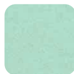
Vert céladon Celadon Green Seladongrün