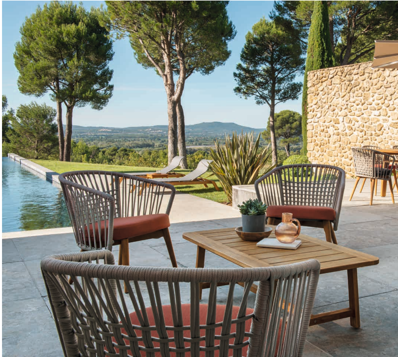
GORDES - Design Radice Orlandini