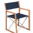
Fauteuil Armchair Sessel