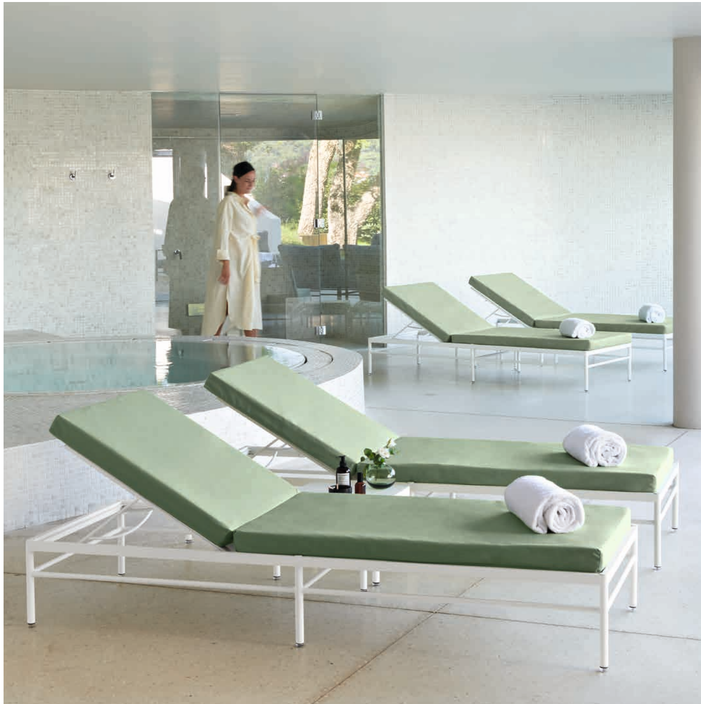
RIVAGE - Design Studio Vlaemynck