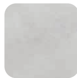
Gris brossé Brushed grey Grau gebürstet