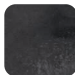
Béton foncé Dark concrete Dunkle betonoptik