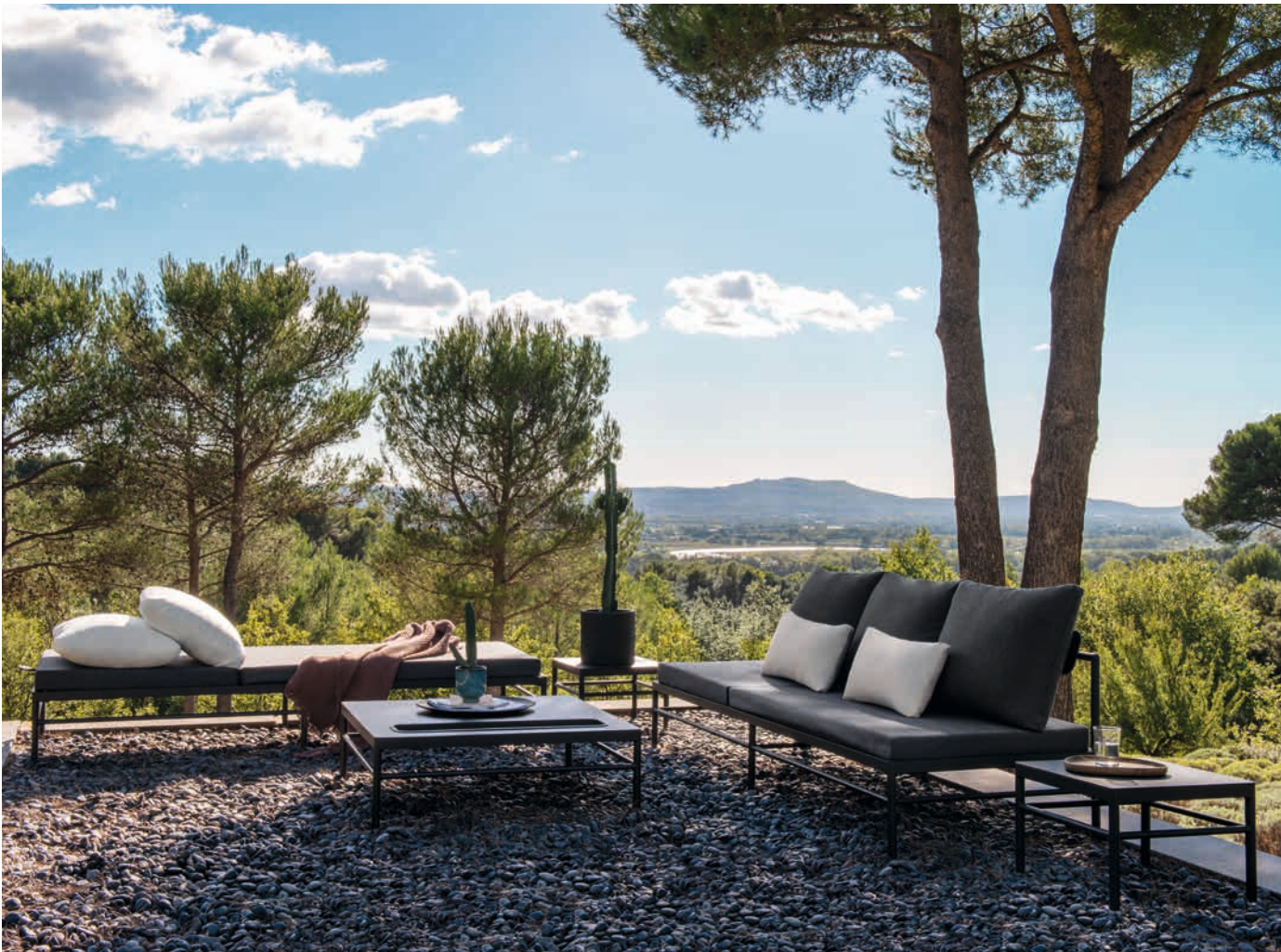
▲ RIVAGE - Bain de soleil et Dossier, Table basse 85x85 cm, Petite table basse 42,5x42,5 cm - Structure aluminium Basalte, matelas et coussins triple dossier toile acrylique Natté Gris nuit, coussins oreiller n° 11 toile acrylique Ecrú et coussins déco n° 88 toile acrylique Natté Ficelle