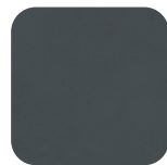
Ardoise Slate Schiefer