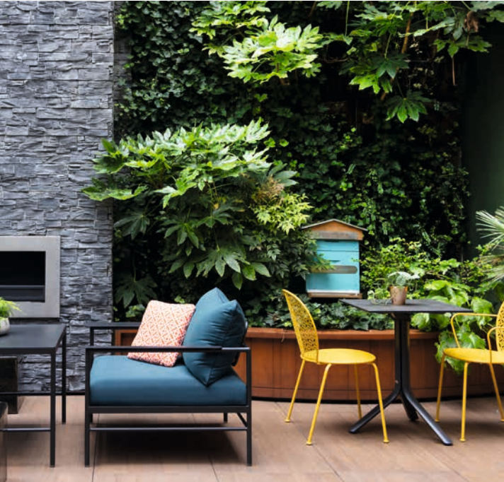
MARTIN RESTAURANT - RENAISSANCE PARIS REPUBLIQUE (France) Collection RIVAGE - Design Studio Vlaemynck Collection LORETTE (Fermob) - Design Frédéric Sofia

Parce que les espaces extérieurs professionnels sont les vitrines des établissements privés comme publics, ils doivent être personnalisés, attractifs et pensés dans leur globalité. Mobiliers, luminaires, séparateurs, parasols et accessoires déco créent des aménagements complets pour trouver le style qui vous ressemble. Depuis 2013, Vlaemynck, marque française d'excellence de mobiliers outdoor et parasols pour l'hôtellerie et la restauration, a rejoint Fermob, marque française de mobiliers extérieurs en couleur et en métal, ainsi que de luminaires. Les marchés professionnels sont les marchés historiques du groupe Fermob, avec la chaise Bistro qui équipait les limonadiers au XIX e siècle. Depuis ce sont plus de 60 collections et 400 références produits qui sont venues alimenter le catalogue professionnel, auxquelles il faut encore ajouter les adaptations et produits sur-mesure. Le département Contract dédié aux professionnels propose les offres produits des deux marques. Le catalogue Fermob est disponible auprès de votre interlocuteur commercial.