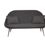
Sofa 2 places 2-seater sofa 2-sitzer-sofa