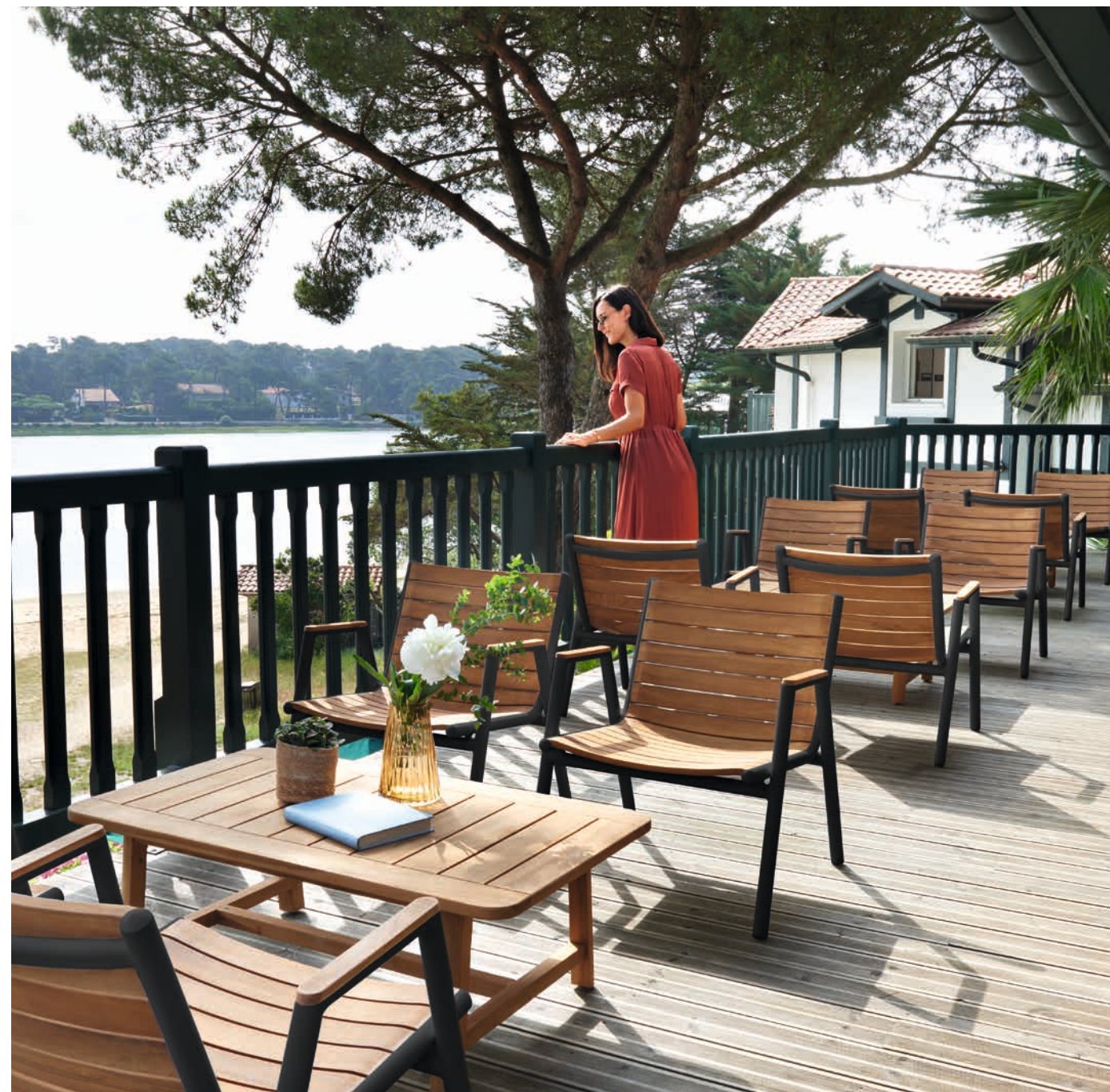
PILOTIS - Design Natalia Rodari & Alberto Basaglia