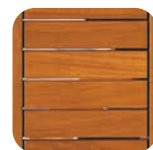
Teck huilé Oiled teak Geöltes Teak