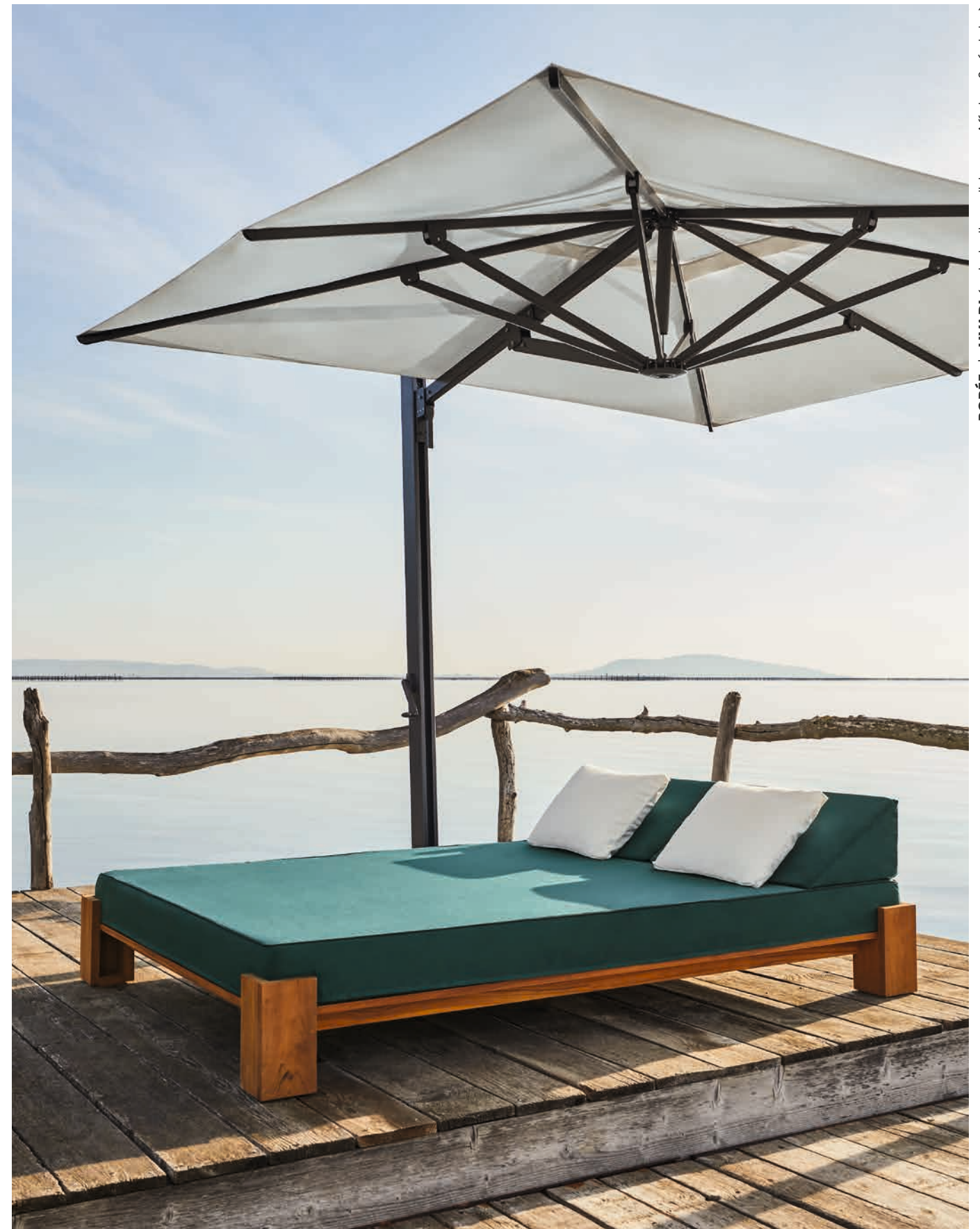
BORÉE | LIVADI (colours available in Bespoke Projects)

Diese Attribute haben wir im Laufe der Zeit weiterentwickelt, um heute selbst den Erwartungen der Luxushotels an der Côte d'Azur zu entsprechen.