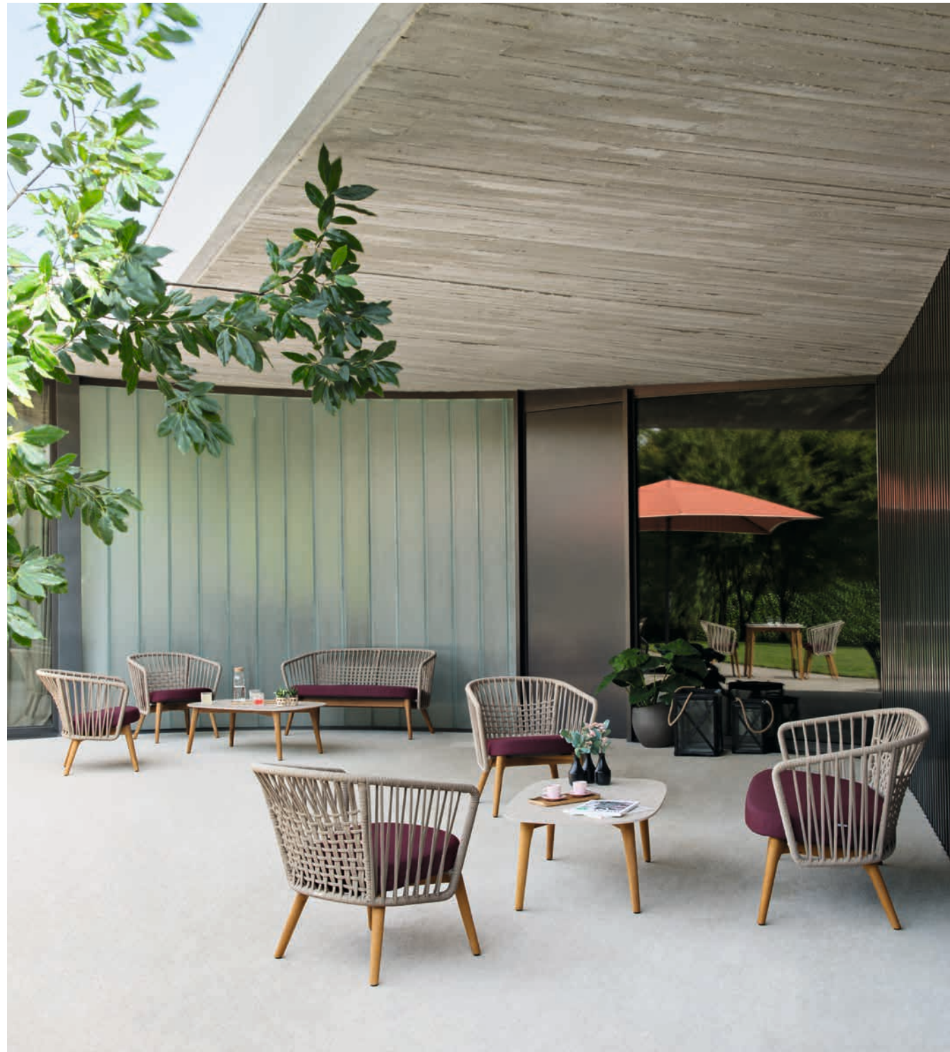
GORDES - Design Radice Orlandini & Design Vlaemynck

▲ GORDES - Fauteuil bas, Sofa 2 places et Table basse 110x65 cm - Structure teck naturel, tresse Beige, toile acrylique Grenat, Plateau de table HPL Effet pierre