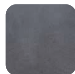
Anthracite brossé Brushed Anthracite Anthrazit gebürstet