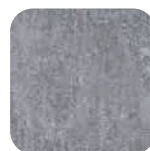
Béton clair Light concrete Helle betonoptik