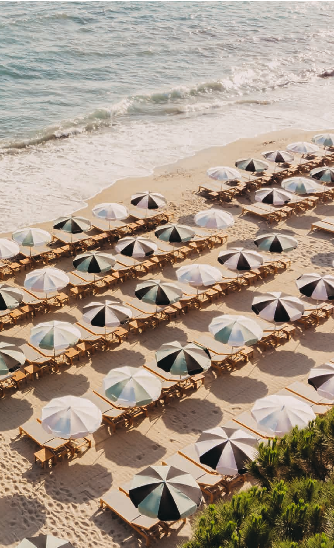
PLAGE DE L'HÔTEL LILY OF THE VALLEY – LA CROIX-VALMER (France) | Collections IBIZA et PLAGE

Mentions légales : Dimensions données à titre indicatif. Photos et textes non contractuels. Le cahier technique ainsi que les éléments qui y sont présentés (mobiliers, textes, photographies, illustrations, schémas, représentations graphiques, logos, etc.) sont la propriété exclusive de la société Vlaemynck. La société Vlaemynck est seule titulaire des droits de propriété intellectuelle portant, notamment, sur le catalogue et sur l'ensemble des créations originales, des dessins et modèles, des brevets et des marques qui y sont présentés. L'utilisation de tout ou partie de ces éléments sans autorisation expresse et préalable de la société Vlaemynck expose à des sanctions et, notamment, à celles prévues par le Code de la propriété intellectuelle au titre de la contrefaçon de droits d'auteur (article L. 335-3 et suivants), de dessins et modèles (article L. 521-1 et suivants), de brevets (article L. 615-1 et suivants) et de marques (article L. 716-1 et suivants) ainsi que par le Code civil en matière de responsabilité civile (article 1240 et suivants).