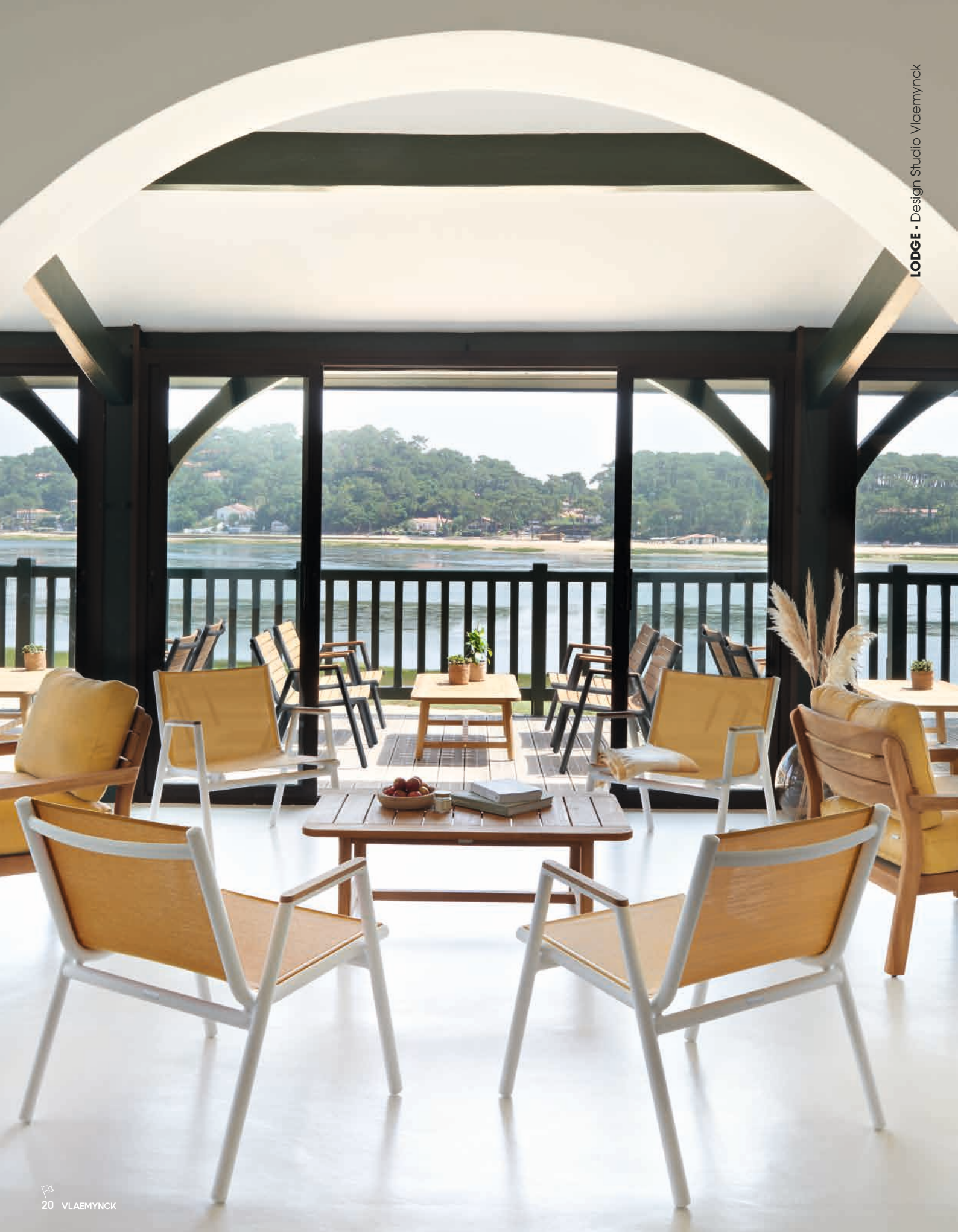
LODGE - Design Studio Vlaemynck