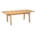
Table 200x105 cm Table 200x105 cm Esstisch 200x105 cm