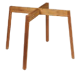
Pied Base Fuss