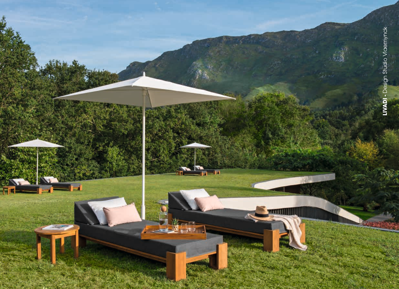
LIVADI - Design Studio Vlaemynck