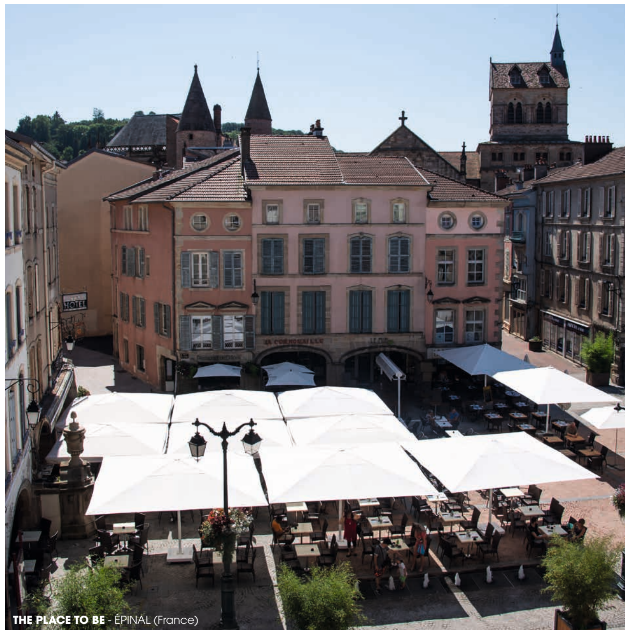
THE PLACE TO BE - ÉPINAL (France)