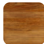
Teck Lamellé-collé Laminated teak Laminiertem Teakholz