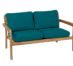
Sofa 2 places 2-seater sofa 2-Sitzer-Sofa