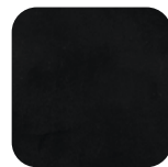
Noir Black Schwarz