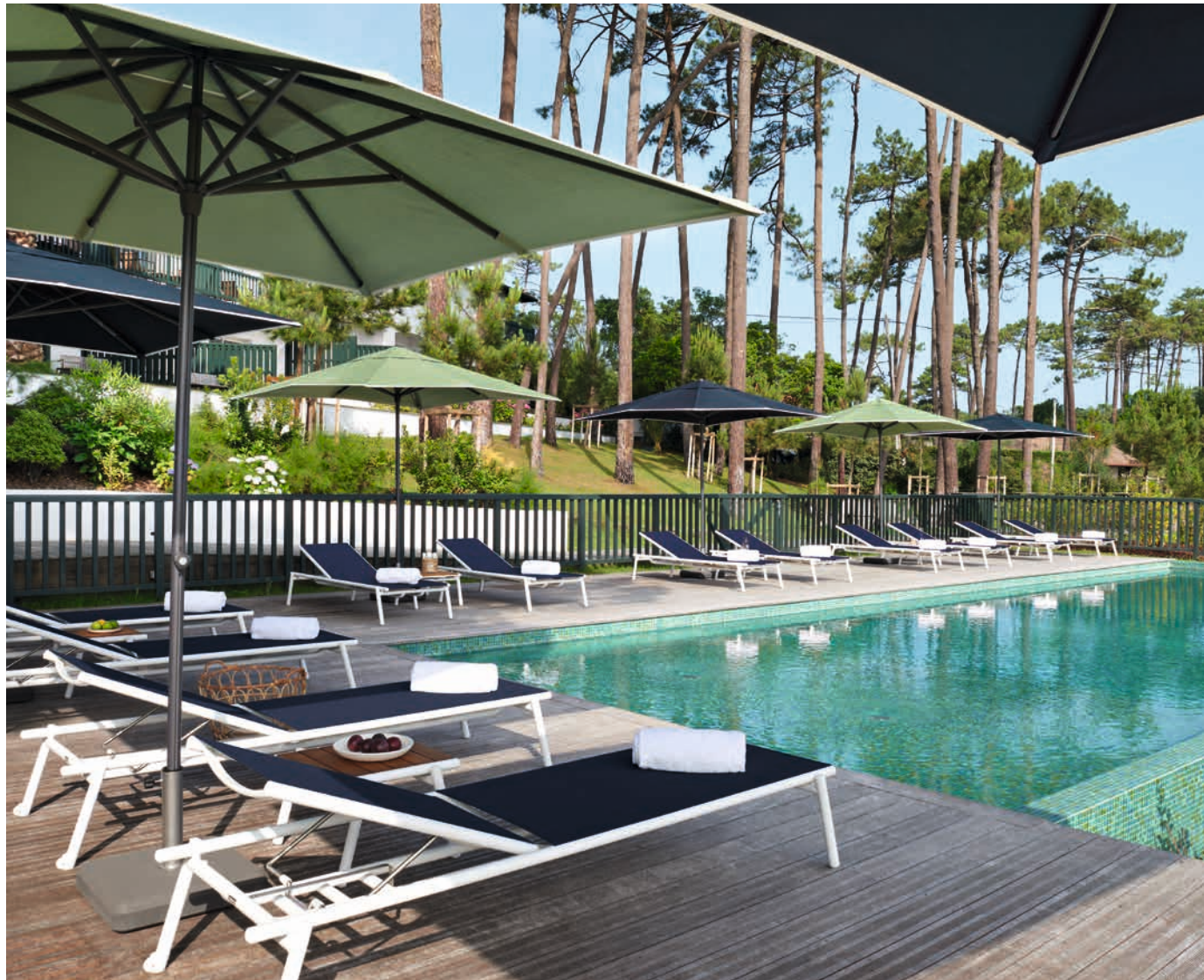
PILOTIS - Design Natalia Rodari & Alberto Basaglia

▲ PILOTIS - Bain de soleil - Structure aluminium Blanc et toile Batyline® Eden Encre bleue - Table basse 54x48 cm - Structure aluminium Blanc - Finition teck naturel