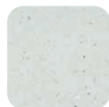
Quartz gris Grey Quartz Quarzgrau