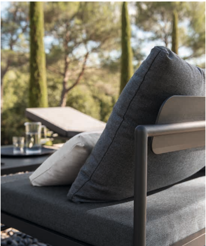
RIVAGE - Sonnenliege und zusätzliche Rückenlehne, Beistelltisch 85x85 cm, sowie kleiner Beistelltisch 42,5x42,5 cm - Aluminium-Rohrrahmen in Basalt, Klappkissen und Kissen mit Dreifacher Rückenlehne Acryl-Flechtgewebe in Nachtgrau, Kopfkissen Nr. 11 Acrylgewebe in Ecrú und Deko-Kissen Nr. 88 Acryl-Flechtgewebe in Creme