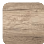
Effet bois Wood effect Holzoptik