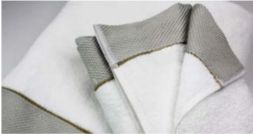
LITEAUX DE COULEUR ET BOURDON COLOURED AND EMBROIDERED BANDS WITH PIPINGS