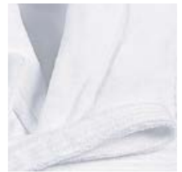
FLUFFY 300 g/m 2 - 300 gsm Col châle, ext. micro-fibre Shawl collar, ext. micro fiber