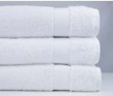
CONCORDE 600 g/m 2 - 600 gsm Blanc, Marbre, Orage Stone, Taupe, Gris White, Marble, Storm Stone, Taupe, Grey