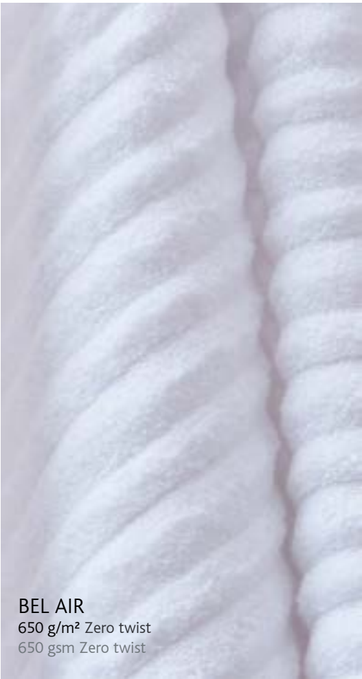
BEL AIR 650 g/m 2 Zero twist 650 gsm Zero twist