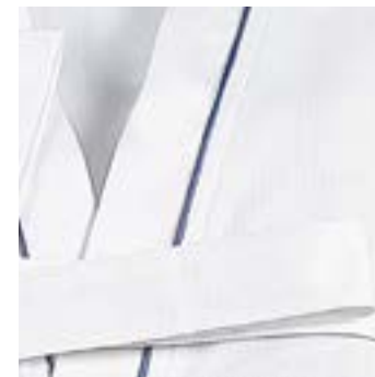
SAPHIR 220 g/m 2 - 220 gsm Col kimono, polycoton Kimono collar, polycotton