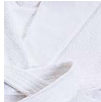
RIAD 280 g/m 2 - 280 gsm Col châle & capuche Shawl collar & hood