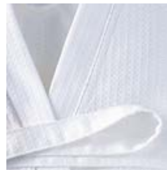
DIAMANT 270 g/m 2 - 270 gsm Col kimono - Finition passepoil blanc Kimono collar - Finishing white piping