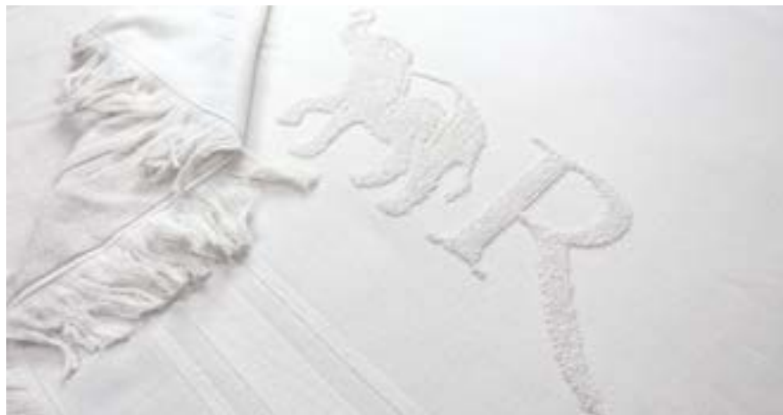
FOUTAS AVEC INSCRIPTION TISSÉE JACQUARD WOVEN FOUTAS