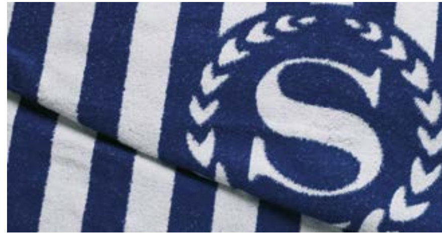
ÉPONGE TISSÉE EN 2 COULEURS Prévu pour lavage professionnel TOWEL FABRIC WOVEN IN 2 COLOURS Made for Hospitality washing process