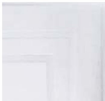
QUADRA 580 g/m 2 - 580 gsm 50x75 cm