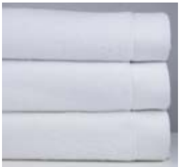
ROYALE 500 g/m 2 Zero twist 500 gsm