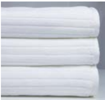
RANELAGH 500 g/m 2 500 gsm