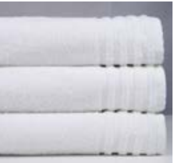
OXANNE 450 g/m 2 450 gsm