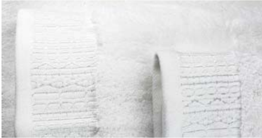
LITEAUX DAMASSÉS DAMASK BANDS