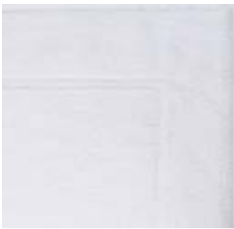
OXANNE 620 g/m 2 - 620 gms 50x85 cm