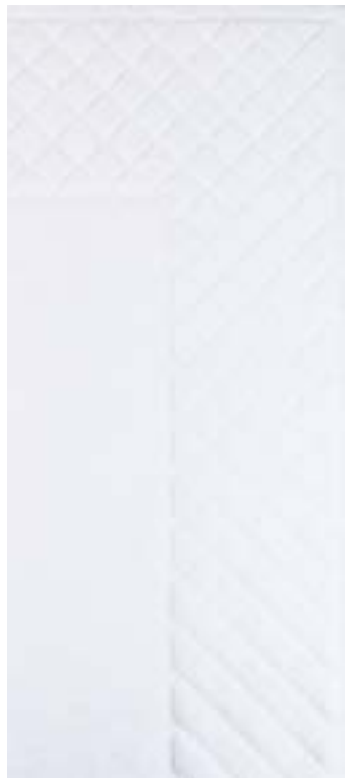
PAIMPOL 800 g/m 2 Velour 800 gsm - Velvet 50x85 cm