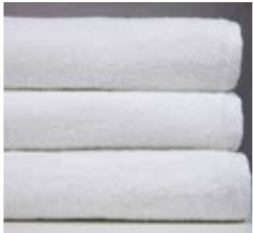
PRINCESSE 500 g/m 2 500 gsm