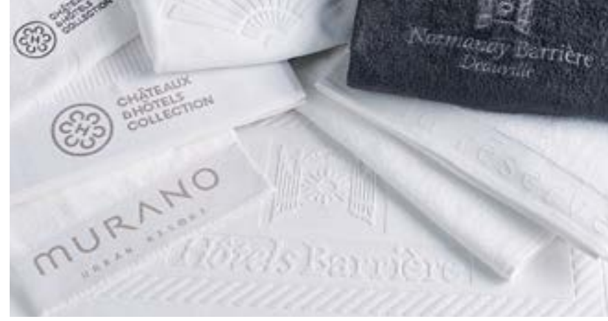
BRODERIES SUR LITEAUX EMBROIDERED BANDS