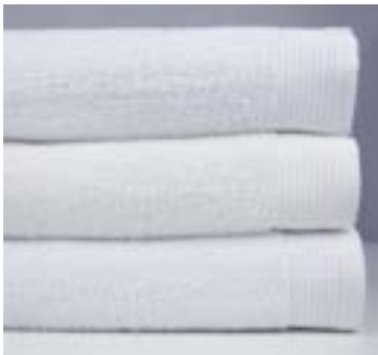
QUADRA 400 g/m 2 400 gsm