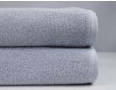
TRANSAT 450 g/m 2 - 450 gsm Gris, Stone - Grey, Stone 100x200 cm