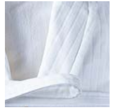
RANELAGH 400 g/m 2 - 400 gsm Col châle, Velours côtelé Shawl collar, Ribbed velvet