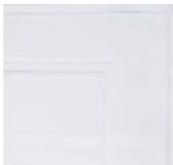
CONCORDE 900 g/m 2 - 900 gsm 50x85 cm