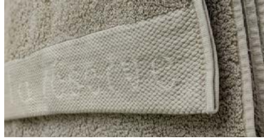
SERVIETTES DE PISCINE COLORÉE COLOURED POOL TOWELS