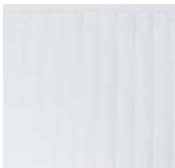
RANELAGH 800 g/m 2 - 800 gsm 50x85 cm