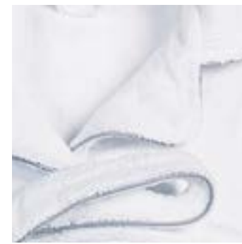
ROYALE 400 g/m 2 - 400 gsm Col tailleur, micro-coton blanc Tailored collar, white microcotton