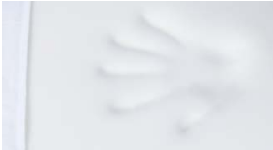
DESCENTE DE LIT - BEDSIDE RUG Mousse à mémoire de forme - enveloppe jersey & housse polycoton Memory foam- jersey case & polycotton cover 50x70x3 cm