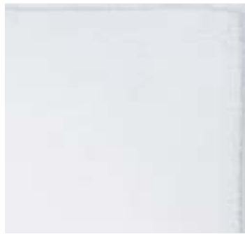
IMPERIAL 1200 g/m 2 - 1200 gms 55x80 cm