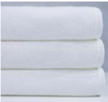
RIAD 280 g/m 2 280 gsm