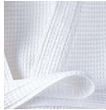
NID D'ABEILLE 200 g/m 2 - 200 gsm Col kimono - Kimono collar