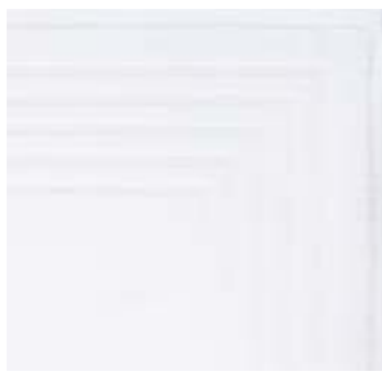
SYDNEY 750 g/m 2 - 750 gsm 50x85 cm